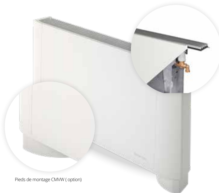
Pieds de montage CMWW ( option)