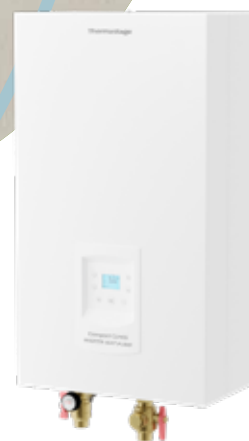
Thermostage Compact Single