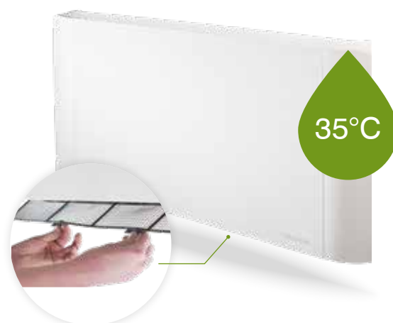
Le filtre est facile à nettoyer et extractible par le dessous.

Contrairement à un radiateur, le convecteur Convexia peut aussi bien chauffer que refroidir. Pour ce faire, l'installateur ne doit prévoir lors de l'installation qu'une évacuation de l'eau de condensation. À cet effet, la pompe à chaleur doit disposer de la fonction de refroidissement et l'installateur ne doit prévoir qu'une évacuation des condensats. Si vous souhaitez passer du refroidissement au chauffage, vous devez commuter manuellement la pompe à chaleur et le Convexia.